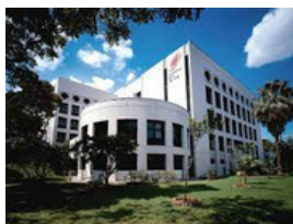
(新加坡國家皮膚中心)

多年來，衛生署只聚焦處理病人皮膚上的問題，而未有正視因銀屑病帶來的其他問題如共病及情緒方面的困擾。同樣為慢性病的糖尿專科，醫管局已在各區設立糖尿病中心，為病人提供全面的診症、教育與及併發症普檢服務。相比之下，更突顯銀屑病友所得的醫療服務有欠全面。