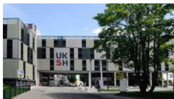
(荷爾斯泰因大學醫學中心)

新加坡則成立了國家皮膚中心（National Skin Center）。中心是由一組皮膚病專家所領導的專科門診所組成，共有19個部門，不僅濕疹、藥疹各有專責部門，連指甲、頭髮都一一細分，每天處理大約1,000名患者。中心設立的銀屑病部門，特別照顧銀屑病患者。該部門積極參與銀屑病的研究，範圍包括銀屑病的臨床試驗，流行病學研究和基礎研究。部門還與自助服務支持小組新加坡銀屑病協會（PAS）合作。