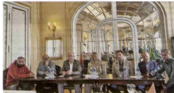
Процена је да у Србији има око 140.000 пацијената са овим обољењем

– Биолошка терапија значајно смањује промене на кожи или чак потпуно чисти кожу. Биолошки лекови су ефикасни и безбедни, тако да не