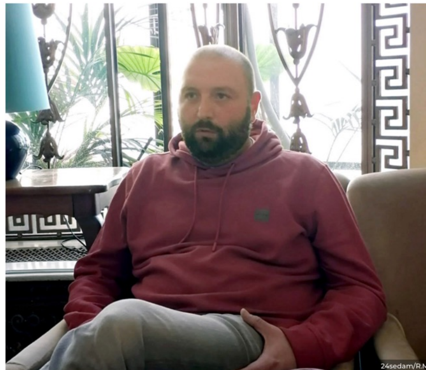
Oko 70 odsto kože bilo mu zahvaćeno bolešću

Koža mu je bila upaljena i tadašnja procena lekara je bila da je bio životno ugrožen!